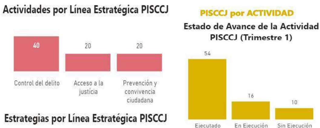
Gráfica 3-2 Actividades plan de acción

Es pertinente aclarar que las actividades que se clasificaron como en ejecución presentaron algún tipo de retraso en la ejecución trimestral, pero se tiene proyectado cumplir con la ejecución en el trimestre II; mientras que las actividades que no tienen ejecución no se implementaron y ejecutaron por desfinanciación u otros problemas que no permitieron la ejecución en el trimestre.