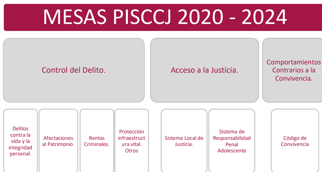
Gráfica 1-1 Estructura mesas de seguimiento al PISCCJ

La estructura de las Mesas Técnicas tiene como objetivo asociar y evidenciar los delitos y/o problemáticas específicas, según la prioridad de atención de estos. En este orden de ideas, los delitos o factores de riesgo priorizados coinciden, de forma clara y pertinente, con el diagnóstico que se elaboró en el marco de la construcción del PISCCJ en donde se identificaron los delitos y comportamientos que mayor impacto generar en la ciudad.