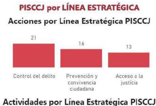
Gráfica 3-3 Líneas estratégicas y estrategias

Se presenta la distribución y número de acciones de acuerdo con la Línea Estratégica asociada. Para este caso, podemos indicar que no existen grandes diferencias en la cantidad de acciones por Líneas Estratégica, sin embargo, es claro que los temas asociados a la Línea Estratégica de Control del Delito son mayoritarios, seguida de las acciones formuladas en Prevención y Convivencia Ciudadana.