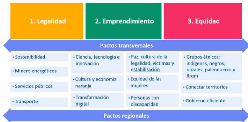
Imagen consultada y extraída el día 31 de marzo de 2020 en la página web:

El Plan Nacional de Desarrollo: “ Pacto por Colombia, Pacto por la Equidad ” (2018-2022), cuenta con veinticinco (25) pactos, los cuales se dividen en Pactos estructurales, Pactos transversales y pactos regionales.