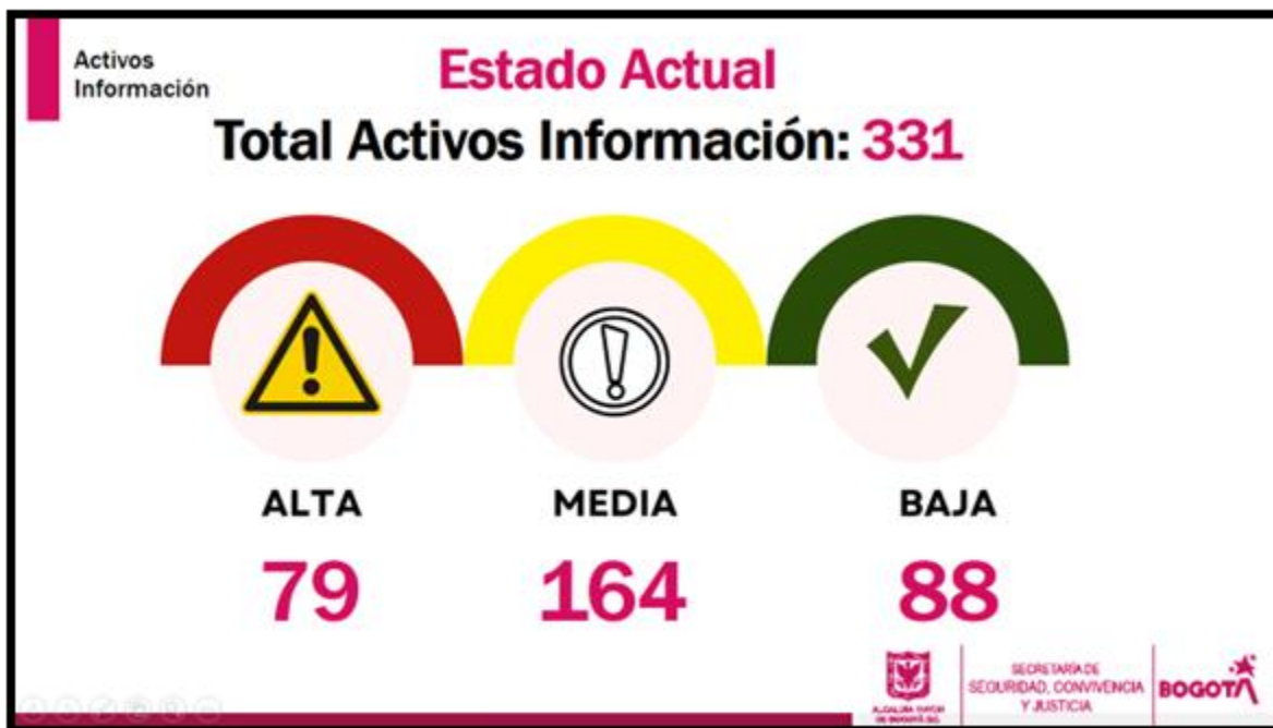
Grafica 1. Elaboración propia

El desarrollo de la matriz de riesgos de seguridad digital se basa en el trabajo previo de levantamiento de activos de información, realizado en la vigencia 2022 para los 18 procesos y 26 áreas de la Entidad, donde se validaron un total de 331 activos de información, los cuales fueron valorados por el personal de las áreas encargadas de acuerdo a los principios de Confidencialidad, Integridad y Disponibilidad de información, de los cuales 79 activos fueron clasificados con una valoración de criticidad Alta, 164 activos fueron clasificados con una valoración de criticidad Media y 88 activos fueron clasificados con una valoración de criticidad Baja.