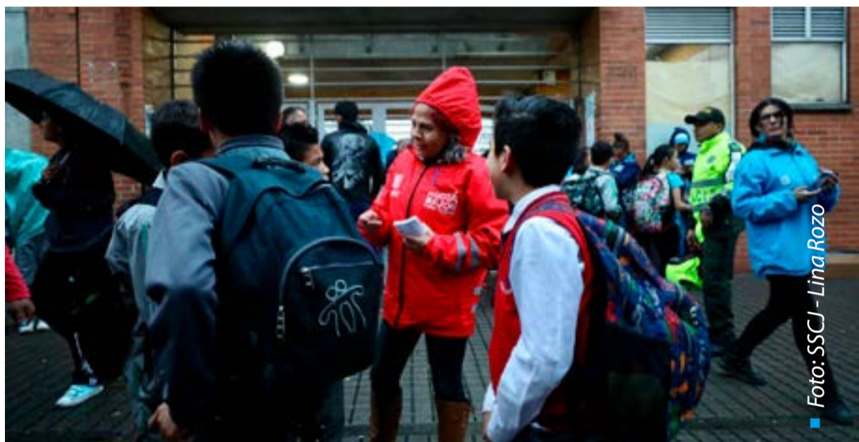
■ Los Gestores de Convivencia acompañan la entrada y salida de los niños, niñas y adolescentes en los colegios priorizados por el Distrito.

Juventud (Idipron), la Personería Distrital, entre otros, acompañan a la comunidad educativa tanto a la entrada como a la salida de sus jornadas escolares.