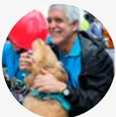
Enrique Peñalosa @EnriquePenalosa

Ayer no registramos homicidios en Bogotá. Finalizamos mes de Julio con una reducción del 23%. Y en el acumulado del año del 9%