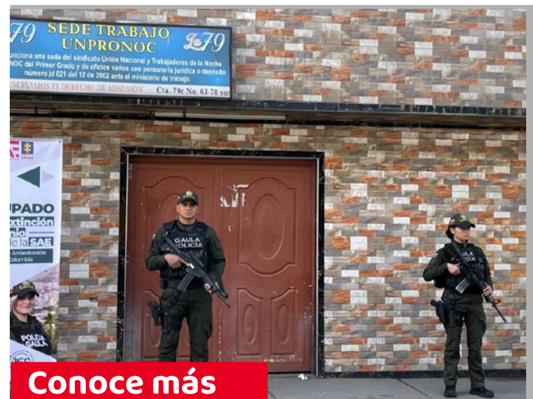
Bosa - Kennedy

Nueve inmuebles que servían como soporte financiero del 'Tren de Aragua' dejaron de estar al servicio del crimen organizado en Bogotá. En una acción coordinada entre el Gaula de la Policía, la Fiscalía y la Secretaría de Seguridad, fueron afectados bienes ubicados en Bosa y Kennedy, entre ellos un hotel y varios establecimientos nocturnos que operaban bajo fachada de sindicatos. Estos espacios eran usados para extorsiones, venta de estupefacientes, licor adulterado y planeación de otros delitos, con un impacto económico superior a los 8.100 millones de pesos.