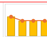
Tabla N°11. Medición Meta 1950 PDD- Bogotá Camina Segura Fuente: SEGPLAN – Oficina Asesora de Planeación- https://www.sdp.gov.co/gestion-a-la-inversion/programacion-y-seguimiento-a-la-inversion/seguimiento 31/03/2025 – 31/07/2025 - 31/09/2025

De acuerdo con SEGPLAN, con corte al 30 de septiembre de 2025, se registra lo siguiente: