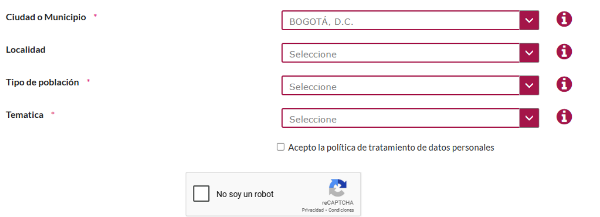
Imagen N° 6 Formulario llamada para personas sordas – Fuente: Pagina web institucional.

El siguiente es el formulario publicado en la página web institucional: