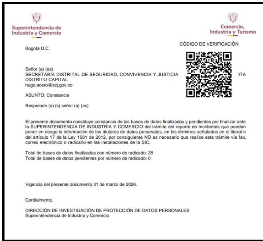
Imagen N° 1 Reporte RNBD - SIC 2025– Fuente: Respuesta emitida por la DTSI en respuesta a memorando de apertura de seguimiento.