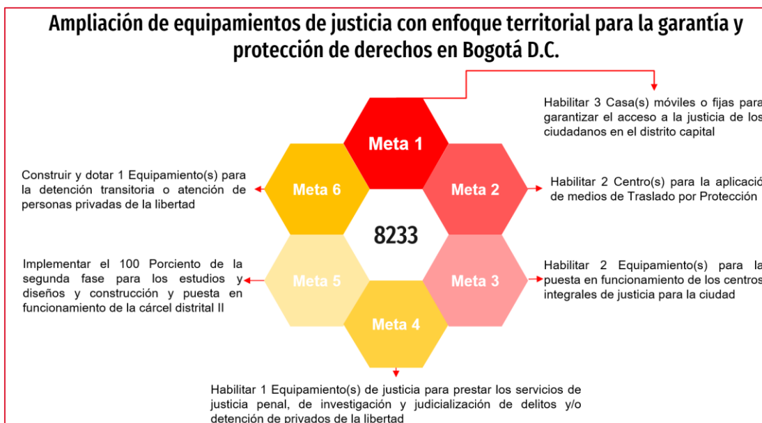
Imagen N°01. Actividades Proyecto de Inversión 8233

A continuación, se relaciona las actividades del proyecto de inversión en mención: