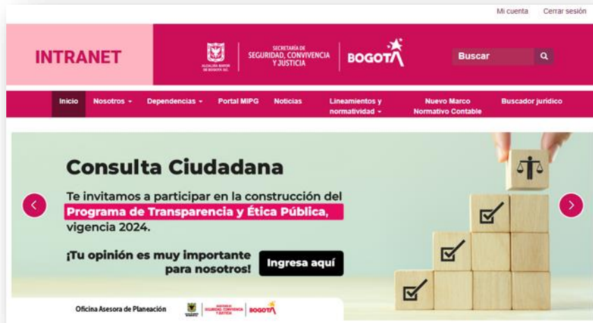
Ilustración 1 – Medio interno (intranet)