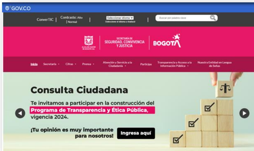
Ilustración 2 – Medio Externo (página WEB)

El proceso de participación ciudadana contó con el diseño de un formulario para registrar los aportes. Como resultado de este, se recibieron un total de 20 sugerencias, las cuales se analizaron y se identificó que en el programa ya se contaban con actividades que cubrían la necesidad de las observaciones.