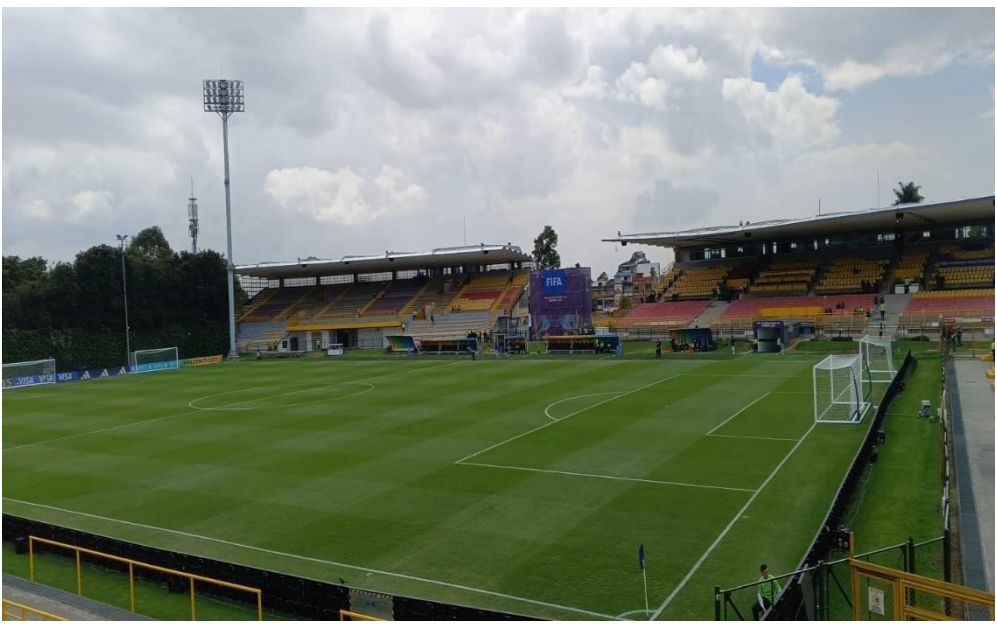
Ilustración 6 Estadio Metropolitano de Techo