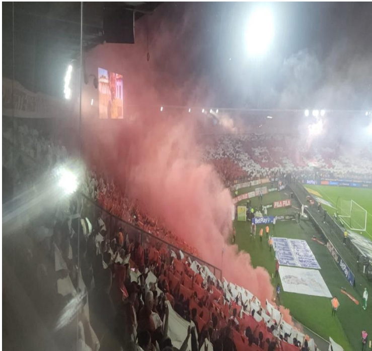
Ilustración 23 Activación Tarros de Humo

El uso de pirotecnia y efectos especiales debe estar autorizada por parte de la empresa y/o productor/a beneficiario/a del permiso para el uso del espacio, que para este caso corresponde al equipo que juega como local en el estadio el Campin, dicha actividad debe estar incluida dentro del permiso de aprovechamiento económico que se suscribe con el IDR.