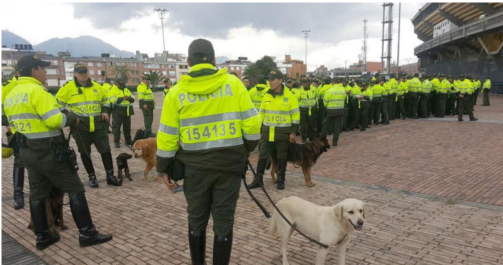
Ilustración 46 Servicio de Policía Principal Estadio El Campín

Si en algún momento se requiere analizar una medida excepcional a lo previsto en este documento, deberá citarse a todas las entidades para que de común acuerdo se tomen las decisiones correspondientes y puedan ser incluidas en la actualización subsiguiente del protocolo.