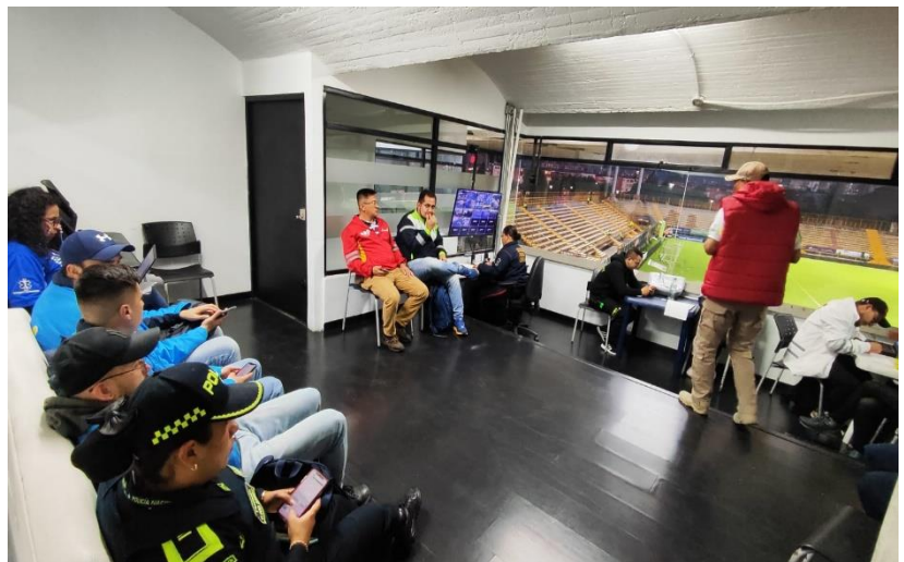
Ilustración 10 PMU Estadio Metropolitano de Techo

Si en algún momento se requiere analizar una medida excepcional a lo previsto en este documento, deberá citarse a los representantes de todas las entidades para que de común acuerdo se tomen las decisiones correspondientes, según lo establecido en el Decreto Distrital 599 de 2013. Se hace necesario que se dispongan equipos institucionales de apoyo adicional para que acompañen el proceso de evacuación en el entorno exterior de los escenarios.