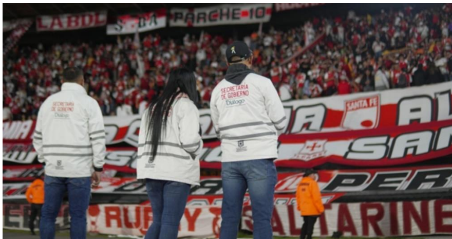
Ilustración 27 Equipo de Dialogo Social SDG

Esta capacitación será obligatoria para la totalidad de los miembros de los equipos de apoyo que asisten los partidos de fútbol en Bogotá, la SDMujer y la SDSCRD, diseñara un plan de capacitación para el efecto y se diseñaran los mecanismos de control para garantizar que todos cumplan con este proceso.