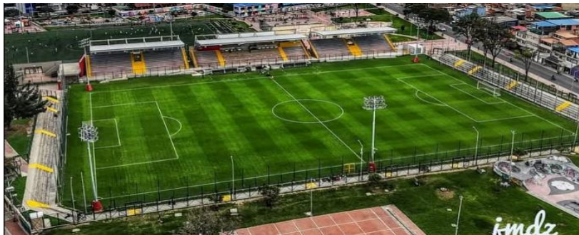
Ilustración 7 Estadio Enrique Olaya Herrera

Parágrafo 1: Se debe disponer la realización de acciones de IVC en los alrededores de los estadios donde se desarrollarán partidos considerados de alto riesgo como finales o clásicos históricos, antes, durante y después, con el fin de evitar el expendio y consumo de licor y sustancias psicoactivas que puedan terminar afectando la seguridad y convivencia dentro del estadio.