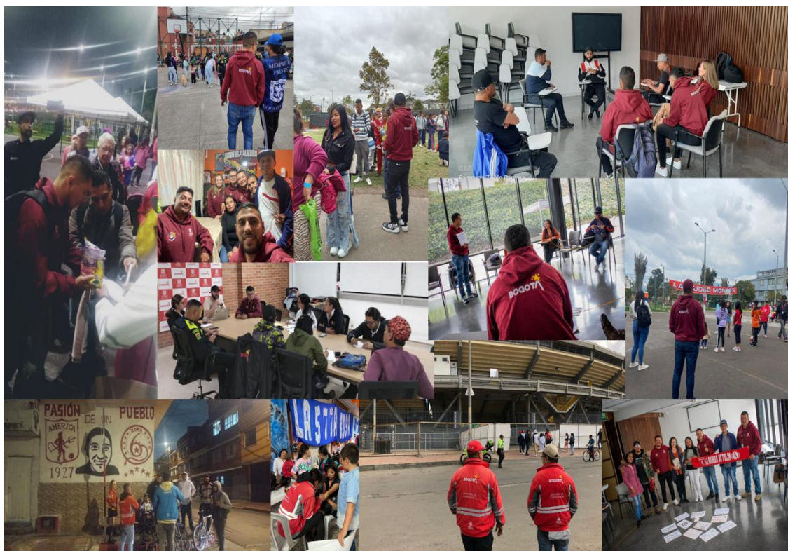
Ilustración 32 Acciones equipo VOBFAF

Para el logro de esta línea de acción, se plantean seis herramientas a) Indagación de casos; b) Cartografía Social; c) Historias de Vida; d) Encuesta de Opinión; e) Trueque Futbolero; f) Festival Alegoría a la Memoria Futbolera.