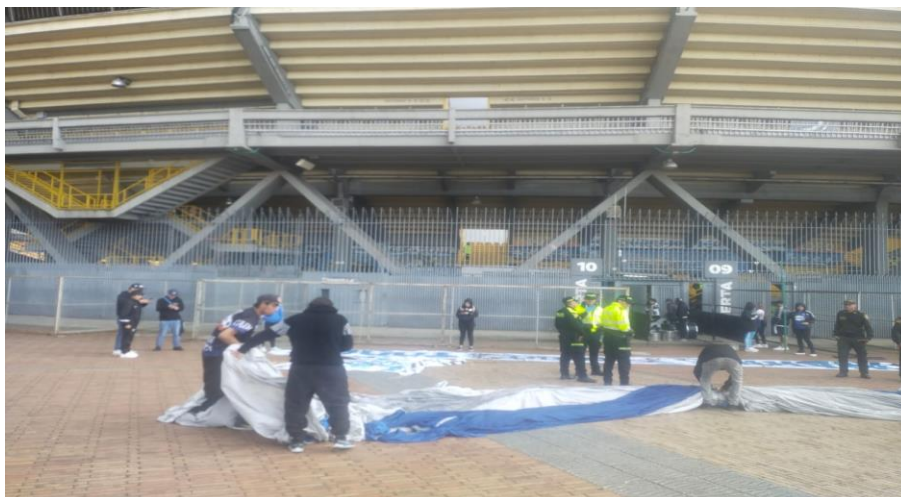
Ilustración 43 Revisión de elementos de las barras fuente GEP

Parágrafo 7: Los instrumentos de viento pueden ingresar fuera del horario establecido para los otros elementos.