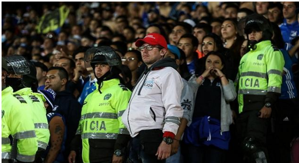
Ilustración 33 Equipo de Gestores de convivencia en estadio

Los clubes deben realizar reuniones bimestrales con las barras y deberán enviar a la Comisión las actas de mencionadas reuniones.