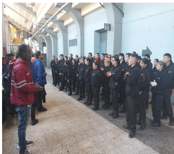
Ilustración 18 Verificación lectores boletería

Así mismo se deberá instalar en el PMU una pantalla donde se pueda visualizar en tiempo real el registro de ingresos por cada puerta y/o tribuna del estadio del estadio.