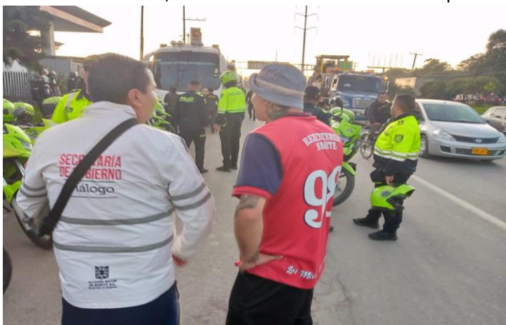
Ilustración 29 equipo GEP en puesto de control Barras

A través de esta, se implementan acciones de carácter preventivo frente a posibles conflictos y tensiones, contribuyendo al cumplimiento del PDSCCF, fortaleciendo la convivencia y el diálogo en los espectáculos de fútbol en cuatro momentos identificados, uno de preparación, uno previo a los encuentros, uno propiamente desarrollado en el contexto del estadio durante el partido y uno posterior al mismo, a continuación, se relacionan las acciones correspondientes: