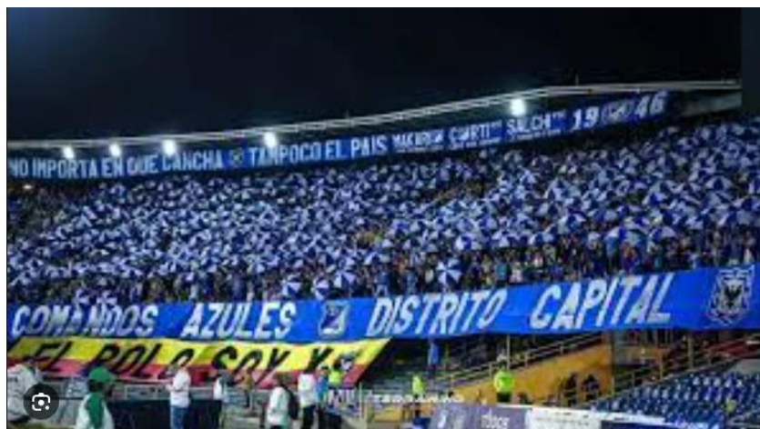
Ilustración 36 barra CADC