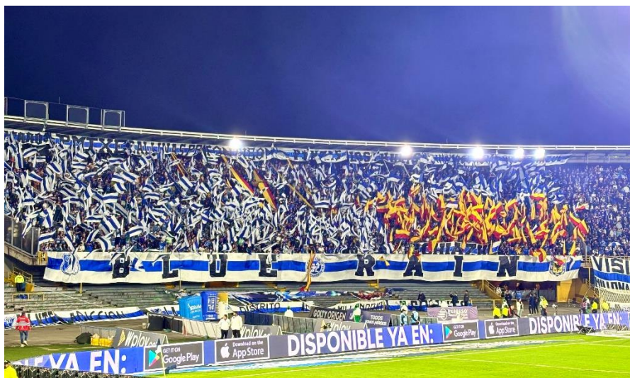
Ilustración 38 Barra Blue Rain

En lo que respecta a las banderas y pancartas utilizadas (trapos), el procedimiento policial se asegurará que ninguna de ellas lleve contenidos ofensivos hacia cualquier institución sea pública o privada. Sin embargo, siempre se definirá según lo establecido en la ley 1270 y estatuto del aficionado, Artículo 31. De los elementos de animación y el comportamiento en el escenario deportivo. El aficionado debe respetar la normatividad que limita el porte de objetos, bebidas o sustancias prohibidas o susceptibles de generar o posibilitar la práctica de actos violentos; de dar consentimiento para la requisa personal de prevención y seguridad; no portar o mostrar carteles, banderas, símbolos u otras señales con mensajes incitadores de violencia, inclusive de carácter racista o xenófobo; no entonar cánticos discriminatorios, racistas o xenófobos; no arrojar objetos en el interior del recinto deportivo, salvo los que estén previamente aprobados por la comisión local de seguridad, comodidad y convivencia en el fútbol; no portar o utilizar fuegos artificiales o cualquier otro elemento