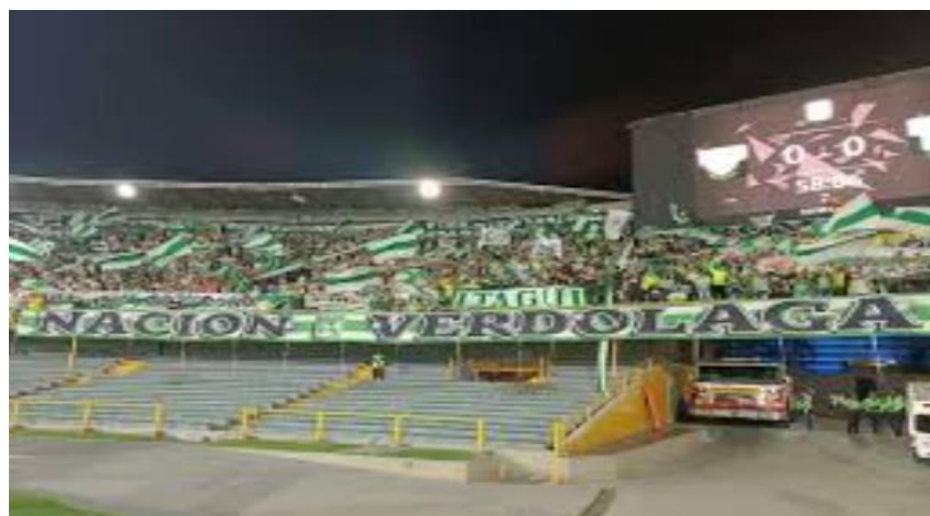
Ilustración 44 Barra Nación Verdolaga