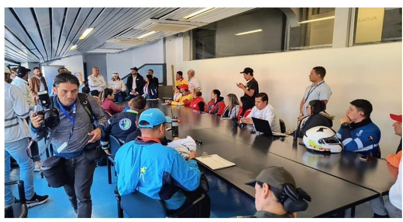
Ilustración 11 PMUA Estadio El Campin Final Liga

Existirá un PMUA al principal, el cual estará ubicado en la planta baja de los escenarios deportivos y/o en aquellos lugares en que resulte más eficaz su presencia, desde el cual se operará en situaciones de emergencia. En este puesto de mando solo podrá participar un representante por entidad, que en este caso serán las personas designadas al frente de cada institución (jefes. Coordinadores Generales, comandantes de Servicios, etc.). En el estadio el Campin se determina en la parte externa el sector del Campincito