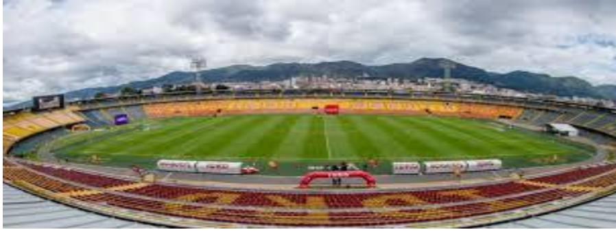
Ilustración 13 Tribunas estadio El Campín fuente IDRD

Tribuna Sur: Tribuna donde se ubicarán las Barras Futboleras Populares de los equipos. La edad mínima de ingreso a esta tribuna será de 14 años.