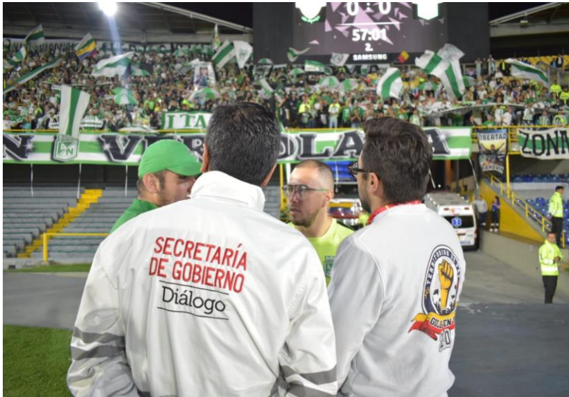
Ilustración 30 Articulación con barras en estadio fuente GEP

c. Estadio: Durante todo el proceso de acompañamiento y monitoreo de los estadios de fútbol profesional durante los encuentros deportivos, se presentan situaciones en este contexto: