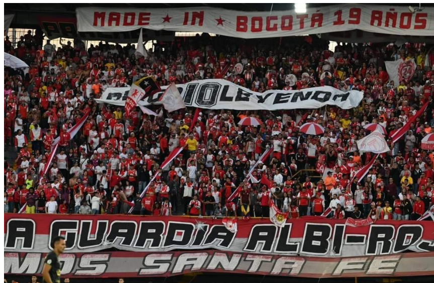
Ilustración 37 Barra LGARS

El retiro de elementos de animación y la evacuación de los asistentes iniciará una vez finalizado el encuentro deportivo