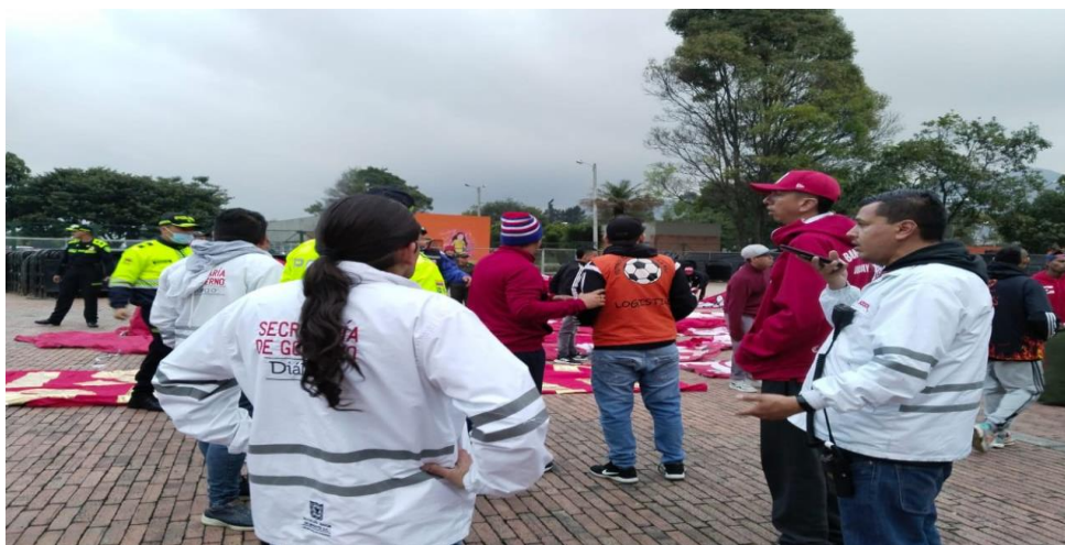
Ilustración 28 Integrantes del Programa GEP