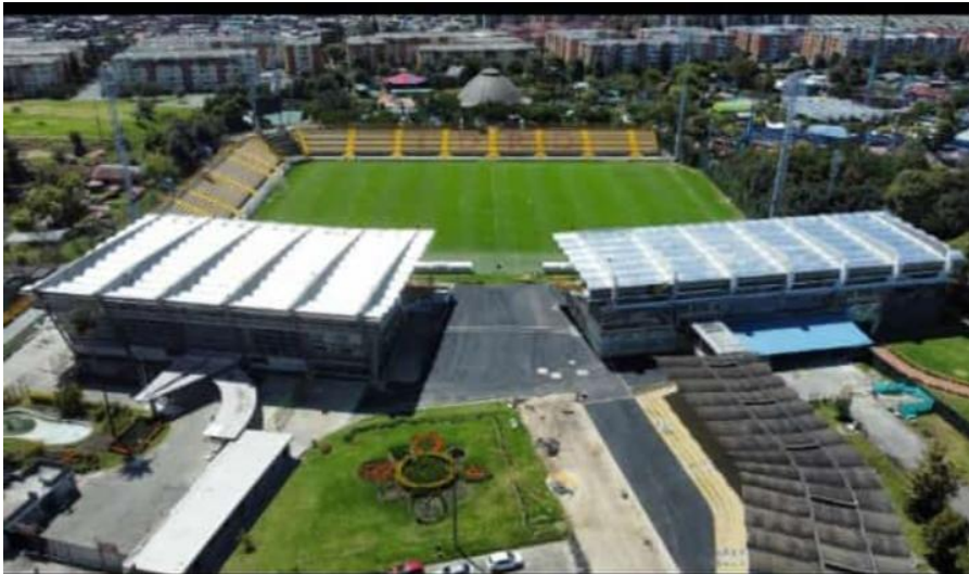
Ilustración 14 Tribunas Estadio de Techo

Tribuna Norte: Tribuna donde se ubicarán las Barras Futboleras Populares de los equipos visitantes