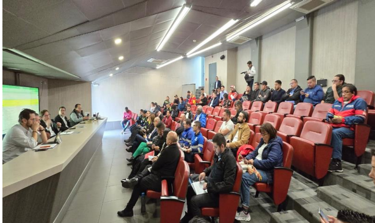
Ilustración 12 Reunión CDSCCFB antes de Final de Liga

Para el caso de partidos Clásicos capitalinos, clásicos históricos o partidos de finales se deben llevar a cabo las siguientes acciones: