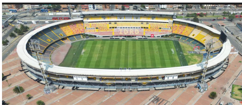
Ilustración 3 Estadio Nemesio Camacho El Campín