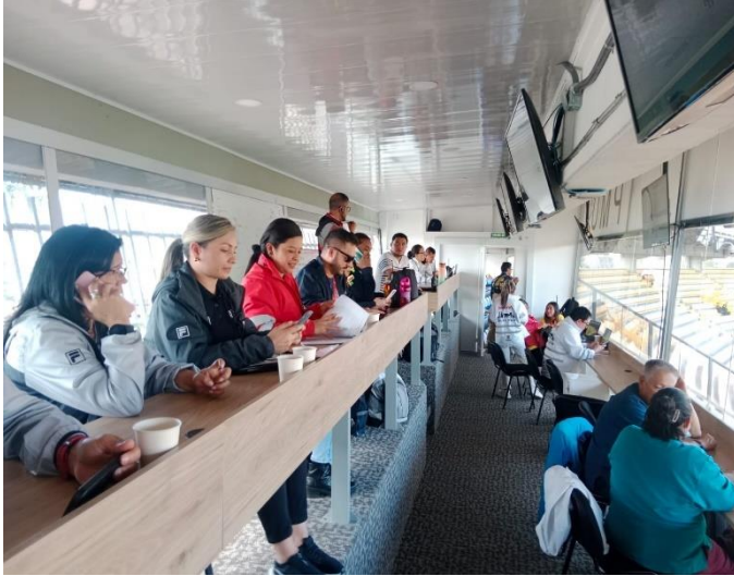
Ilustración 9 PMU Estadio El Campín

De conformidad con lo previsto en el artículo 48 del Decreto Distrital 599 de 2013, modificado por el artículo 10 del Decreto Distrital 622 de 2016, el PMU en los partidos de fútbol, estará integrado por las personas que sean asignadas por las siguientes entidades: