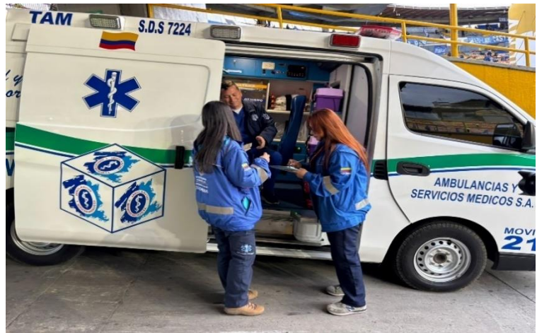
Ilustración 16 verificación recursos plan de salud

De igual manera se debe garantizar para el estadio de Techo la ubicación de un MEC en la tribuna lateral norte cuando esta sea habilitada