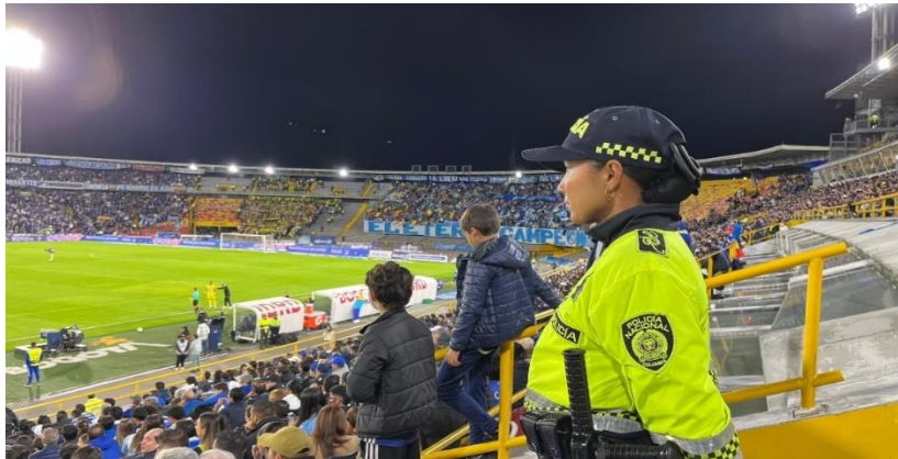
Ilustración 19 tribunas Estadio El Campin