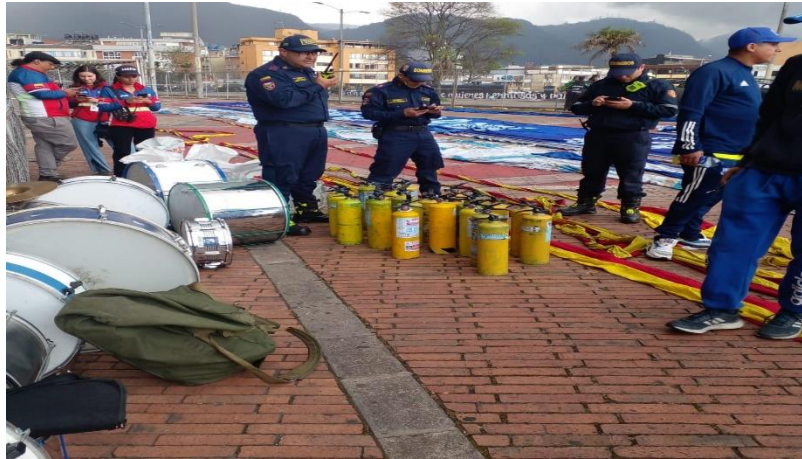
Ilustración 40 Revisión de elementos Barras