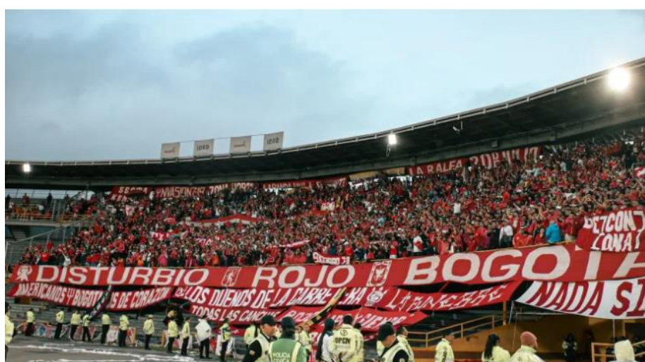
Ilustración 41 Barra Disturbio Rojo

Parágrafo 13: Los instrumentos de viento pueden ingresar fuera del horario establecido para los otros elementos