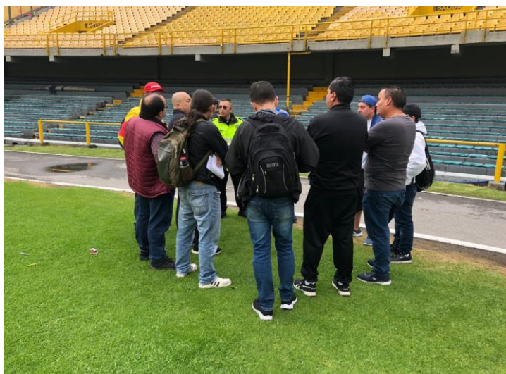
Ilustración 31 Reunión Previa con Barras