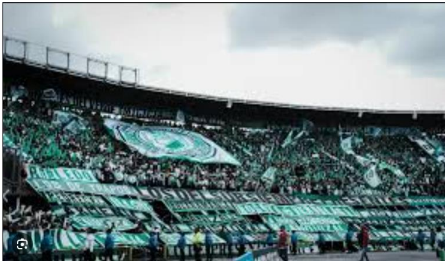
Ilustración 45 Barra Los del Sur