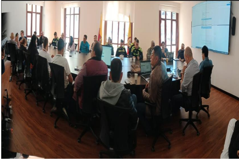
Ilustración 8 Reunión CDSCCFB