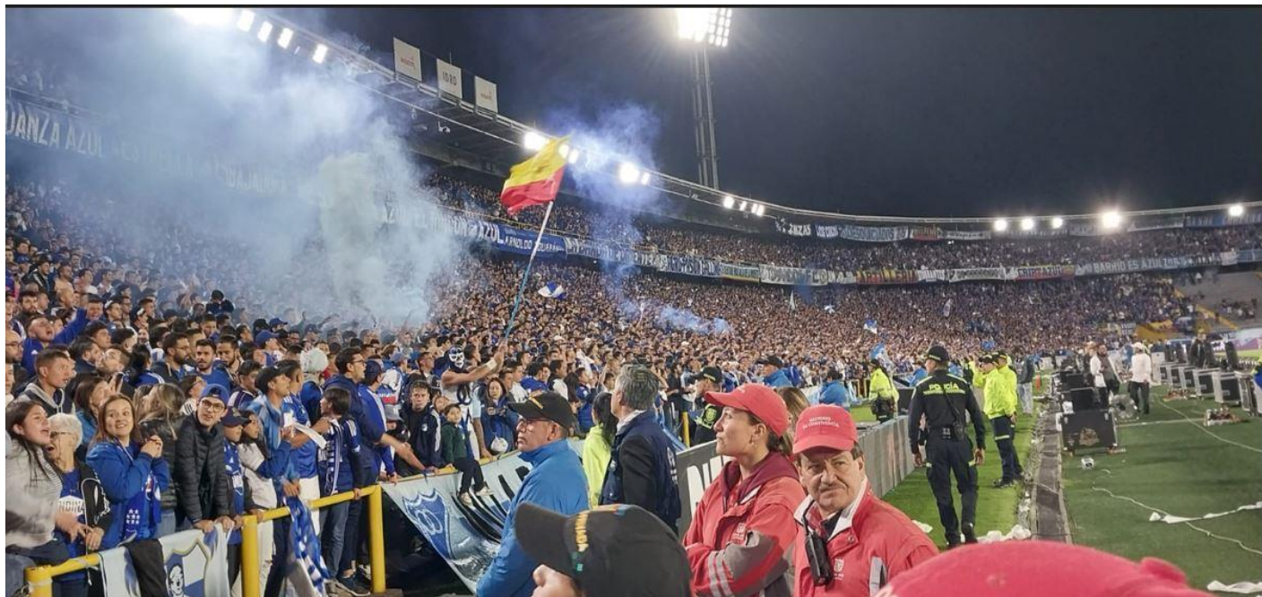
Ilustración 34 Equipo de Gestores de convivencia en estadio