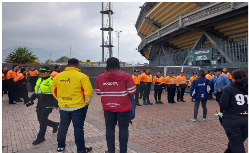
Ilustración 49 Verificación recursos seguridad privada en El Campin

Las empresas de vigilancia y seguridad privada en general tienen como objetivo disminuir y prevenir las amenazas que afecten la vida, la integridad personal o el tranquilo ejercicio de los legítimos derechos sobre los bienes de las personas que reciben su protección. En tal virtud es compatible la actuación de las empresas de vigilancia privada y la protección a un grupo de personas que asisten a un evento, sin embargo, tratándose de aglomeraciones de público complejas que pueden implicar afectación al orden público, la actuación de las empresas de vigilancia y seguridad privadas no puede invadir la órbita de competencia reservada a las autoridades, en este caso, de la Policía. De esta forma, para que las empresas de vigilancia y seguridad privada puedan ejercer el servicio público de seguridad, es necesario que sus funciones no estén dirigidas a defender una comunidad ni al restablecimiento del orden público.