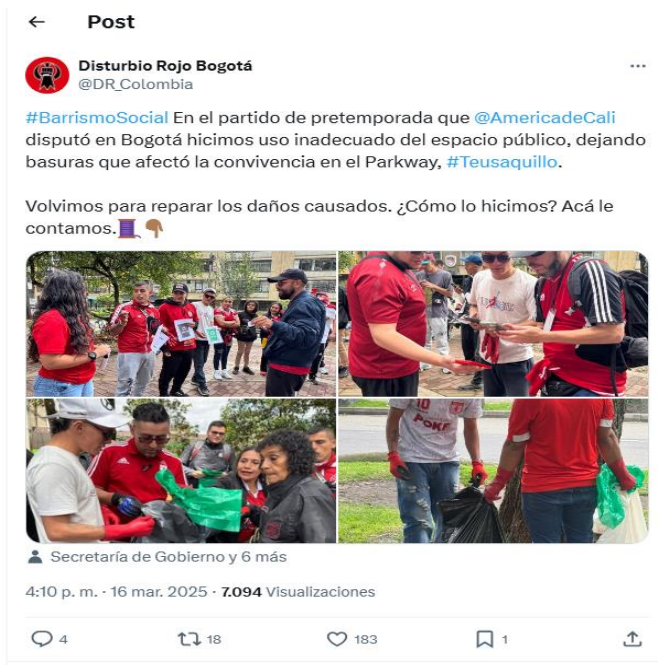
Ilustración 47 Acción pedagógica realizada por las barras de América