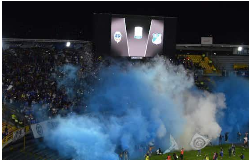
Ilustración 24 Uso de efectos especiales y Humos

Parágrafo 1: Para los partidos de fútbol de la Copa Libertadores de América y Sudamericana, se mantendrán las disposiciones establecidas en el reglamento interno de la Confederación Suramericana de Fútbol (en adelante Conmebol).