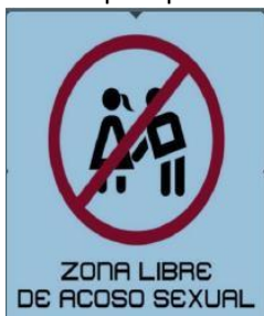
Ilustración 15 modelo de señalética

Se sugiere tener en cuenta que la señalética que se utilice en los escenarios deportivos también puede contribuir al reconocimiento pedagógico de las violencias y delitos contra las mujeres, niños, niñas y adolescentes en estos espacios. Un ejemplo de señalética que se puede adaptar para los escenarios deportivos y sus alrededores es: