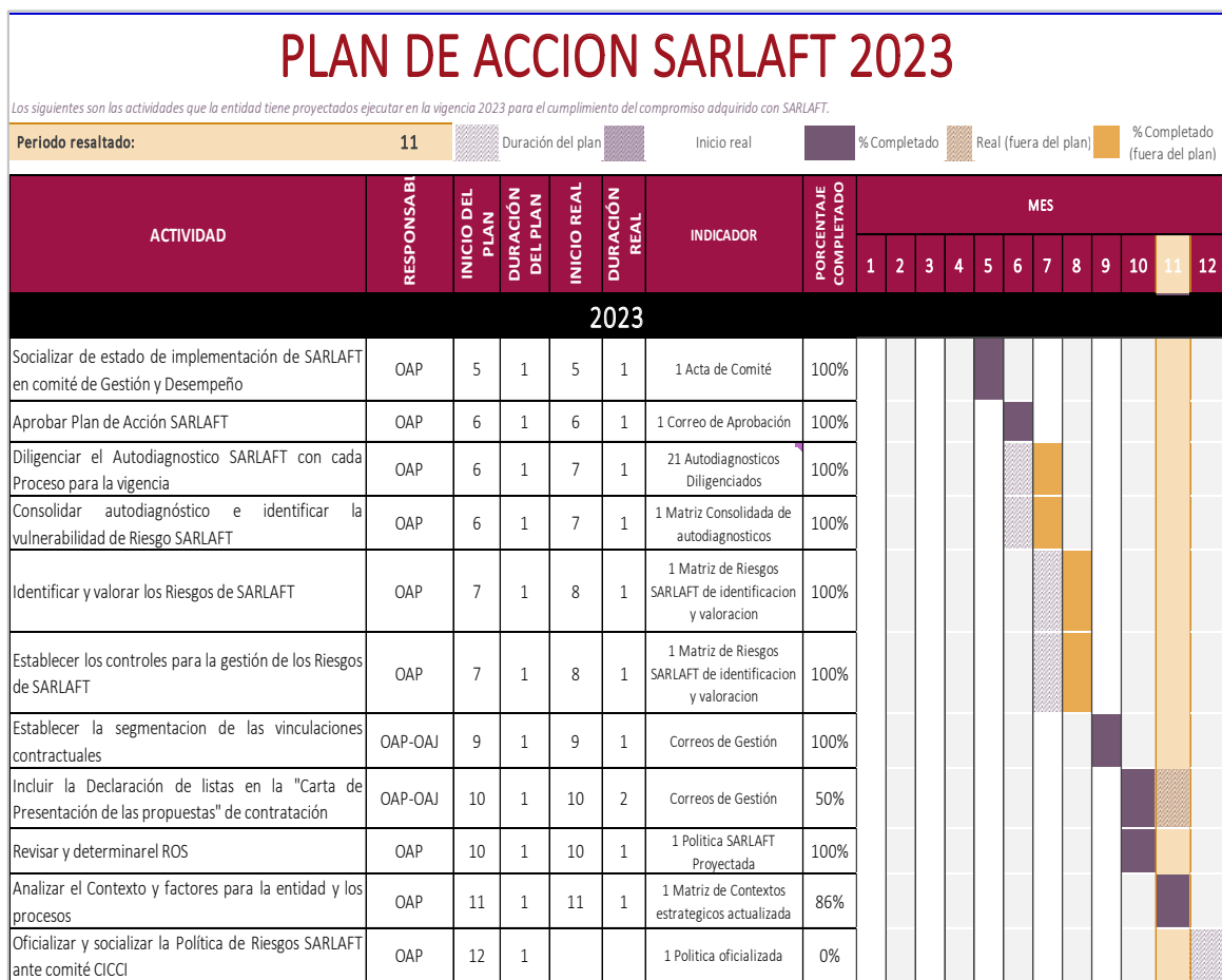
Tabla: 1 Plan de Acción 2023

Para el periodo objeto de seguimiento, y como resultado de la evaluación adelantada por la Oficina de Control Interno, se observó un cumplimiento del Plan del 85 %, el cual había sido comunicado a la Oficina Asesora de Planeación a través del “Informe de Seguimiento a la implementación de SARLAFT en la SDSCJ – Junio a Noviembre de 2023, con radicado 3-2023-43624; documento en el que esta Oficina recomendaba “Continuar y culminar la ejecución de las actividades propuestas en el Plan de Acción 2023, de manera que contribuyan a la prevención y la detección de los riesgos de LA/FT”.