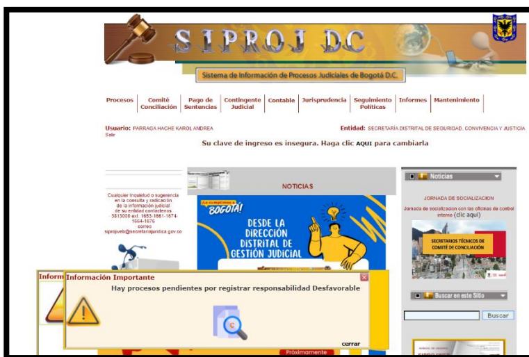
Imagen N° 1. Fuente Sistema SIPROJ-WEB alerta sobre procesos pendientes.

Finalmente la OCI observó al ingresar al aplicativo SIPROJWEB, una imagen que corresponde a una alerta “Hay procesos pendientes por registrar responsabilidad desfavorable”, así: