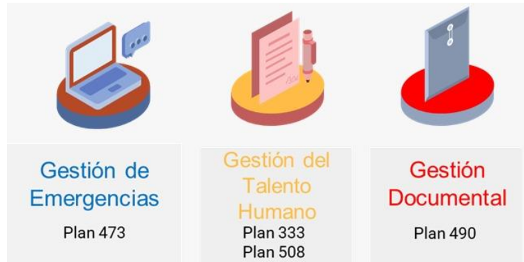
Imagen N° 3. Elaboración propia. Fuente: Reporte acciones Portal MIPG – ITS.

en estado “Abierta” o “Vencida”...”, así mismo indicó que “En estricto cumplimiento de la política operacional N° 7, los reportes que se realicen extemporáneamente serán objeto de revisión por parte de la Oficina de Control Interno en el mes de abril 2025, por lo que la acción se clasificará como “Cerrada-Vencida” una vez culminen su proceso de verificación.”, es así que al 04 de abril 2025 esta oficina ha recibido de manera extemporanea cuatro (4) reportes: