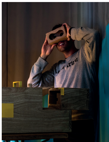
Taller con las herramientas pedagógicas del programa Diálogo .

Un desarrollo integral considera aspectos físicos, afectivos, sociales-culturales, éticos-estéticos y cognitivos, aparece como un derecho universal, asequible a todos, independientemente de la condición personal o familiar. El enfoque pedagógico busca aportar al proceso de reparación y reintegración, según un accionar educativo fundamentado en la pedagogía crítica. Se reconoce en la pedagogía crítica una base para la definición no sólo de las metodologías sino de los roles que se asumen en el momento de implementar escenarios en el marco de un enfoque pedagógico. Con ella, se procura generar conciencia crítica en los participantes, promocionar la individualidad de cada persona desde su autonomía, libertad, apertura al mundo, socialización y el desarrollo de su inteligencia.