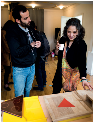
Taller de armado de las herramientas pedagógicas en la sede del programa Diálogo .

Las redes secundarias permiten a las personas establecer