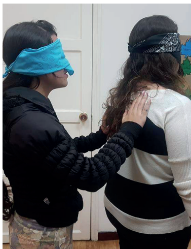
Taller en el espacio de intervenciones de la sede del programa Diálogo .

Se intenta que los jóvenes que entran en calidad de ofensores al programa Diálogo lleguen a generar mecanismos de reparación a las víctimas y a la sociedad (familia y comunidad). En consonancia, el joven ofensor puede reparar y restaurar tanto a la víctima como a la comunidad debido a las consecuencias derivadas de su conducta y del delito. Estas acciones se presentan como la oportunidad de resiliencia para quienes se han visto afectados por el delito. Por un lado, la comunidad se entiende como el sujeto de la restauración al ser la víctima indirecta o secundaria que ha sido vulnerada debido a la alteración de su seguridad y su convivencia. Por otro lado, la víctima directa es el sujeto de la reparación, esta puede ser individual o colectiva. (Padilla, 2012).