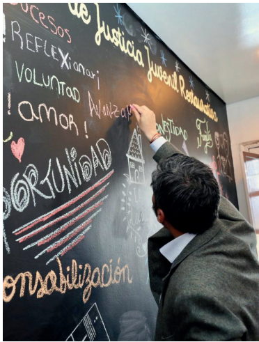
Taller en el espacio de intervenciones de la sede del programa Diálogo .

En el marco del Sistema de Responsabilidad Penal para Adolescentes (en adelante SRPA), el programa Diálogo: justicia restaurativa para jóvenes (en adelante programa Diálogo ) es un espacio cuyas acciones se trazan alrededor de la ejecución de prácticas alternativas al proceso judicial en el marco de la Justicia Restaurativa (en adelante JR). Con el Principio de Oportunidad (en adelante PO) en modalidad de suspensión del procedimiento a prueba se busca que sean garantizados los derechos de los jóvenes ofensores de manera efectiva, por medio de la implementación de rutas de atención diferenciadas para que los jóvenes resuelvan sus conflictos con la Ley.