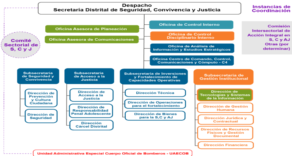
Imagen 1. Estructura Orgánica de la SDSCJ