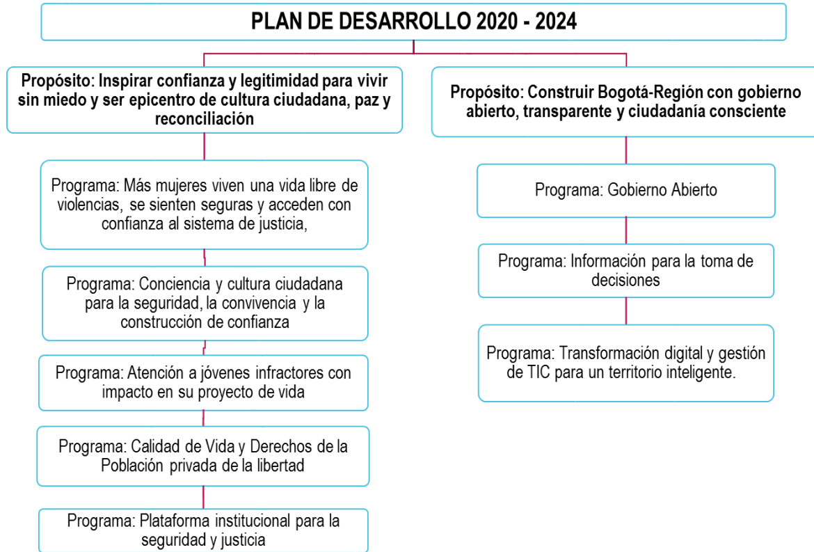
Imagen 2. Propósitos del PDD 2020-2024 que vinculan a la SDSCJ

Fuente: Secretaría de Seguridad, Convivencia y Justicia