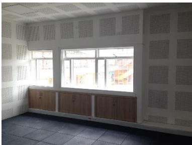
Sala de grabación

A continuación, se presentan algunas imágenes de los espacios intervenidos: