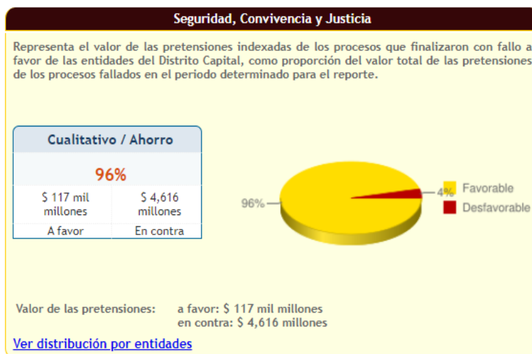
Imagen N° 7 Éxito procesal Cualitativo.

En relación del valor de las pretensiones indexadas, se obtuvo fallo favorable respecto de $117 mil millones de pesos, lo que equivale al 96% y en fallo adverso $4.616 millones de pesos lo que asciende solo al 4% del total pretensional, representando esto un buen nivel de defensa jurídica en lo cualitativo.