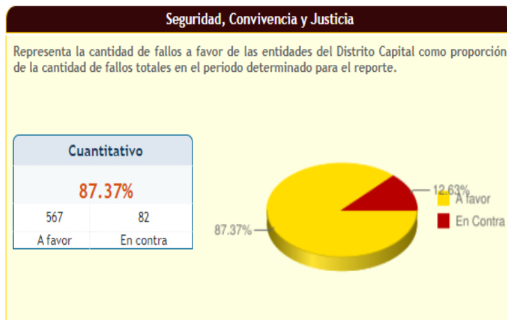
Imagen N° 6 Éxito Procesal Cuantitativo.

El éxito procesal de la entidad, se encuentra establecido con 567 fallos a favor, lo cual equivale al 87.37% y con fallo adverso tan solo en 82 procesos, los cuales representan el 12.63% del total de procesos, considerándose una buena gestión de la defensa jurídica de la entidad en términos cuantitativos.