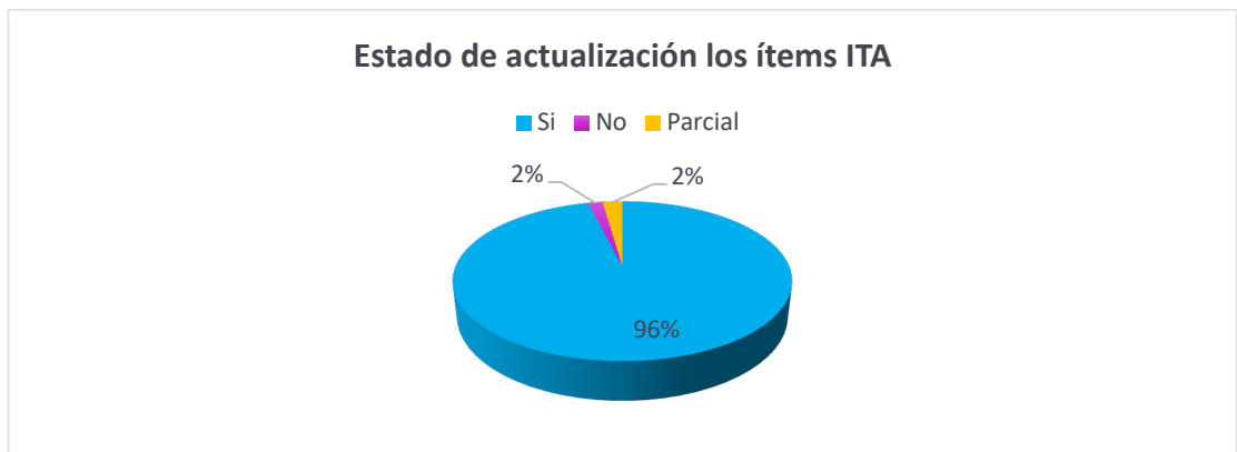
Gráfica No. 1 avance implementación Ley de Transparencia.

En lo concerniente a la actualización de los ítems de la matriz de autodiagnóstico para el registro, seguimiento, monitoreo y generación del Índice de Transparencia y Acceso a la Información – ITA de los 178 ítems que aplican a la Secretaría de Seguridad, Convivencia y Justicia, 171 se encuentran actualizados, 3 ítems están desactualizados y 4 ítems tienen cumplimiento parcial, lo anterior para asegurar el cumplimiento total de la Ley 1712 de 2014 y se presentan las siguientes consideraciones: