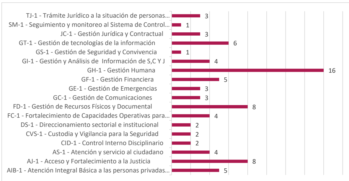
Gráfico No.2. Elaboración Propia OCl. Indicadores por dependencia a corte de 31 de diciembre de 2022.

Esta oficina procedió a realizar la evaluación de los indicadores de gestión para el cuarto trimestre, a continuación se presenta el resumen de los resultados obtenidos para los procesos: