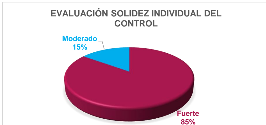
Gráfico 2. Evaluación solidez individual del control.

Verificadas las evidencias de la ejecución de los controles, el resultado de la evaluación fue el siguiente: