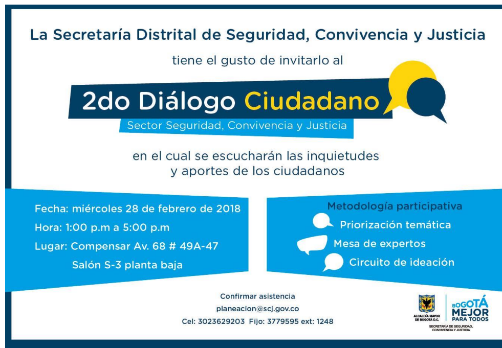
Imagen1. Invitación remitida a los ciudadanos a través de correo electrónico