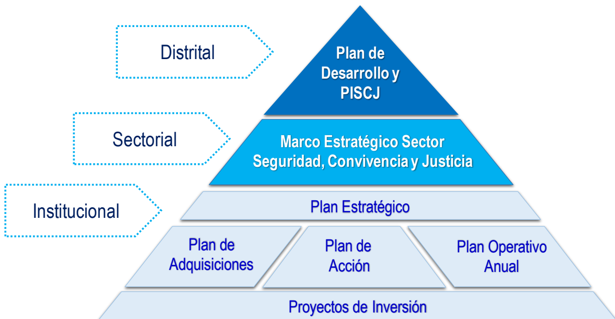
Imagen 1. Sistema de Planeación, programación y seguimiento