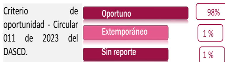
Gráfica N°4. Elaboración propia. Fuente: Información reporte SIDEAP, usuario jefatura OCI.

Verificados los datos relacionados para 741 servidores públicos, se concluyó que 723 presentaron oportunamente la actualización de la declaración de bienes y rentas de la vigencia 2022 (hasta 31 de julio de 2023); 9 la presentaron extemporánea y finalmente en 9 casos no se presentó el reporte, lo que representa un incumplimiento en el 1% de los casos.