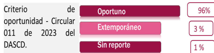
Gráfica N°5. Elaboración propia. Fuente: Información reporte SIDEAP, usuario jefatura OCI.

Validados los datos se concluyó que, de 1.587 contratistas relacionados, 1.523 presentaron oportunamente la actualización de la declaración de bienes y rentas de la vigencia 2022 (hasta 31 de julio de 2023); 53 de manera extemporánea y 11 no se presentaron el reporte, es decir que este caso también se presentó un incumplimiento en el 1% de los casos.