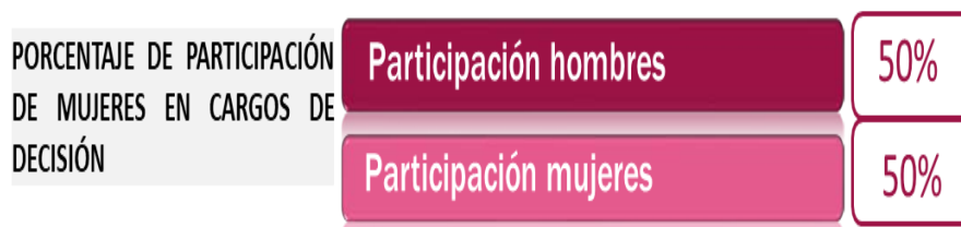
Gráfica N°1.

Analizados los datos, se observó que a 31 de julio de 2023, en la SDSCJ están provistos 6 cargos de máximo nivel decisorio, de los cuales 3 están desempeñados por mujeres, concluyendo que el nivel de participación de mujeres en el “máximo nivel decisorio” es del 50%, dando cumplimiento al artículo 4º de la ley 581 de 2000 y al Decreto 455 de 2020.