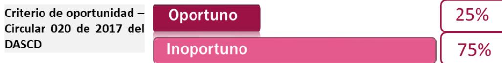
Gráfica N°3. Elaboración propia. Fuente: Información suministrada por Dirección de Gestión Humana.

Como resultado del seguimiento se observó cumplimiento oportuno en los meses de agosto, octubre y noviembre de 2022 en el reporte de registro o actualización ante el SIDEAP por parte de la Dirección de Gestión Humana, lo que representa el 25%, mientras que el restante 75% presentó cumplimiento inoportuno en la fecha de envío (es decir posterior al quinto (5) día hábil siguiente al mes reportado).