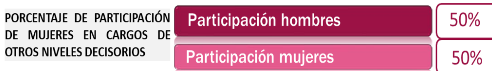
Gráfica N°2. Elaboración propia. Fuente: Información suministrada por Dirección de Gestión Humana.

De lo anterior, se concluye que, el nivel de participación de mujeres en cargos de “otro nivel decisorio” es del 50 %, dando así cumplimiento a lo ordenado por la ley 581 de 2000 y el Decreto 455 de 2020.