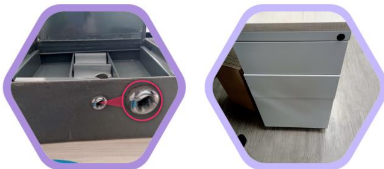
Imagen 2: Fuente: Arqueo de caja

Posteriormente se procedió a consultar los movimientos bancarios, identificando en el extracto del Banco Davivienda con corte a octubre un saldo por valor total de $ 759.000, en relación con la caja, se observó un efectivo de $ 311.400; sin embargo, al inspeccionar el control del efectivo se evidenció que la caja fuerte no se encuentra en buen estado y no cuenta con las llaves respectivas, adicionalmente, durante la visita no se hallaron las llaves correspondientes al mueble en el cual es depositada la caja.