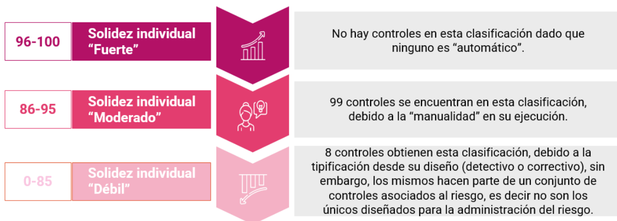
Imagen N° 2. Elaboración Propia. Fuente: Anexo 01 Evaluación Riesgos 2do Trim 2022

A continuación, se presentan los controles con solidez débil: