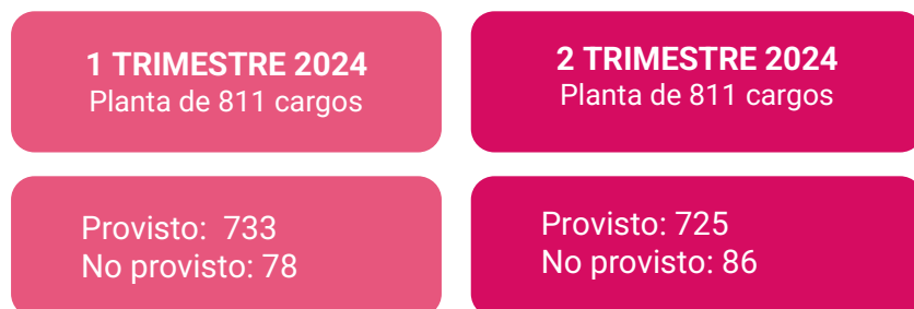
Imagen: 2 Elaboración propia OCI Fuente: Relación Planta de personal DGH

La planta de personal de la Secretaría Distrital de Seguridad Convivencia y Justicia se mantiene constante en comparación con el trimestre anterior, conformada por un total de 811 cargos. Frente a los cargos provistos se presenta una disminución, con una variación del 1,1%, según se aprecia a continuación.