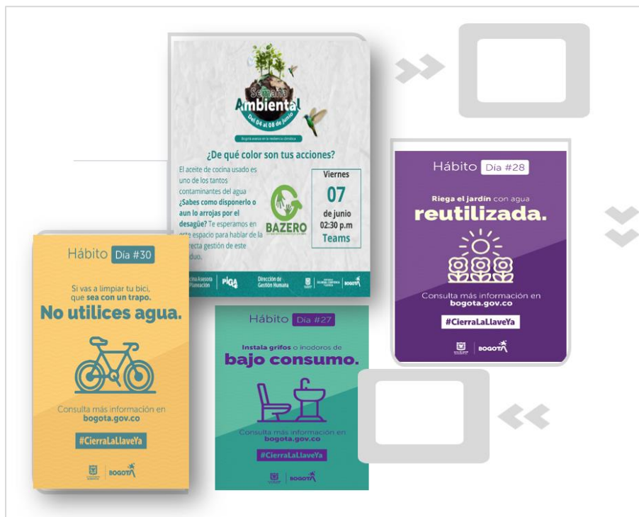
Imagen: 2