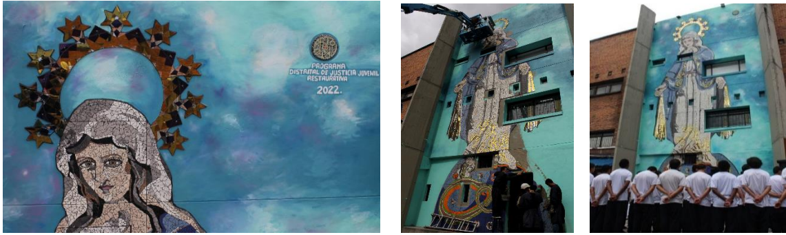
Mural CIP “La Acogida”. Proceso de montaje y acto de presentación.