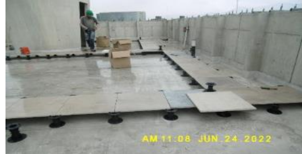
Instalación de piso flotado