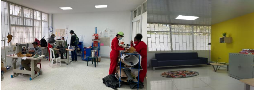
Taller de confección de calzado