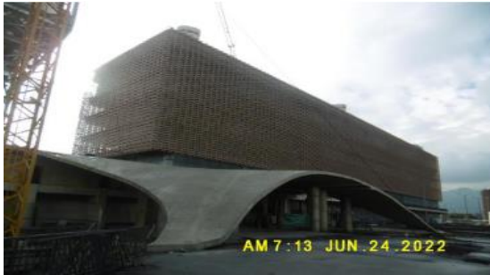
- Fachada suroccidental